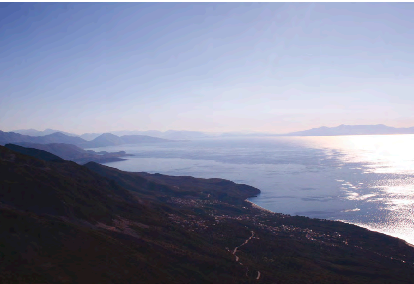
Gjiri i Himarës