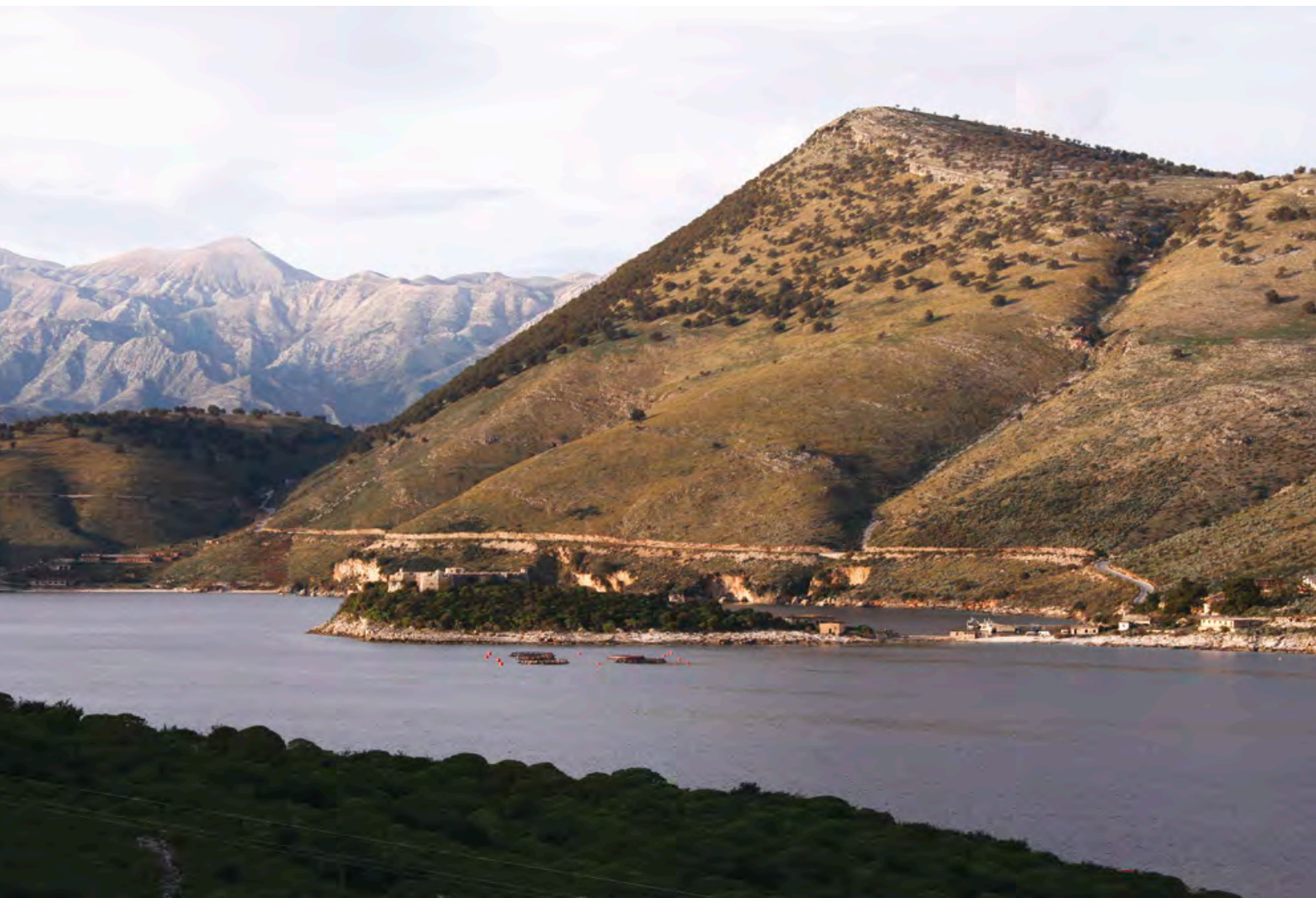
Porto Palermo