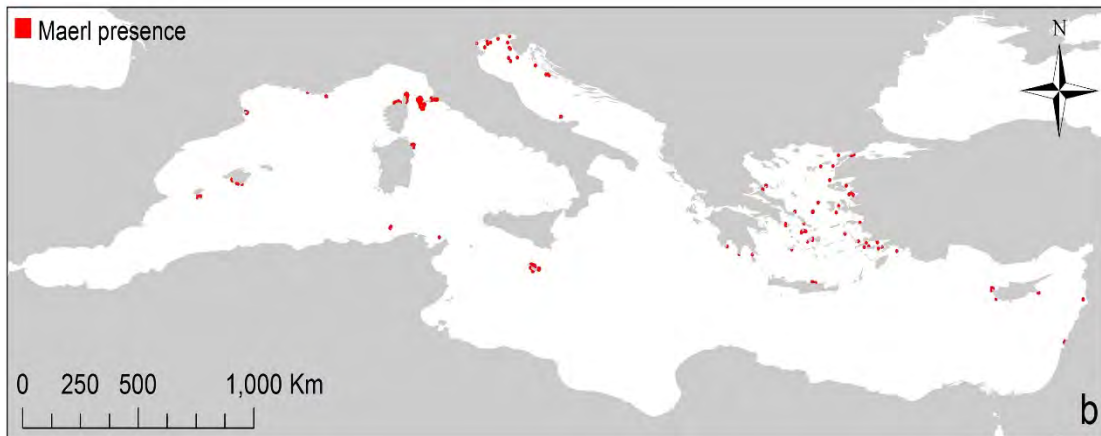
Figure 4. Répartition des habitats des bancs de maërl en Méditerranée (zones en rouge). Données de Martin et al. (2014).

L'habitat des bancs de rhodolithes/de maërl est classé par le système de classification EUNIS récemment révisé avec les codes : MB3511 Association à rhodolithes dans des sables grossiers et des fins graviers brassés par les vagues, MB3522 Association à maërl (= Association à Lithothamnion corallioides et à Phymatolithon calcareum ) sur les sables et graviers grossiers de Méditerranée, MC3523 Association à maërl ( Lithothamnion corallioides et Phymatolithon calcareum ) sur les fonds détritiques. La classification récemment révisée de la Convention de Barcelone (PNUE/PAM-CAR/ASP, 2019b) classe cet habitat avec le code MC3.52 : fonds détritiques côtiers à rhodolithes.