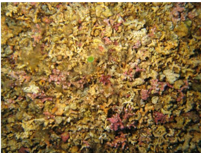
Figure 2. Habitat de rhodolithes.