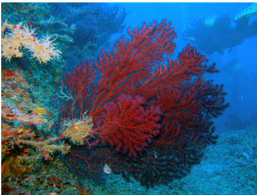
Figure 1. Habitat coralligène.

Les deux formations calcaires les plus importantes et caractéristiques d'origine biogénique en Méditerranée sont représentées par les récifs coralligènes (Fig. 1), un habitat complexe endémique considéré comme le point culminant de la biocénose de la zone circalittorale (Péres et Picard, 1964). Elles sont également représentées par les bancs de maërl/de rhodolithes (Fig. 2) (PNUE/PAM-CAR/ASP, 2008). Ces habitats bio-construits se développent dans la zone circalittorale de la Méditerranée et sont constitués de cadres d'algues corallines qui se développent dans des conditions de faible éclairage. Le coralligène se caractérise par une richesse des espèces, une biomasse et des valeurs de dépôt de carbonate élevées comparables aux récifs coralliens des Tropiques (Bianchi, 2001), et des valeurs économiques supérieures à celles des herbiers marins (Paoli et al. , 2016).