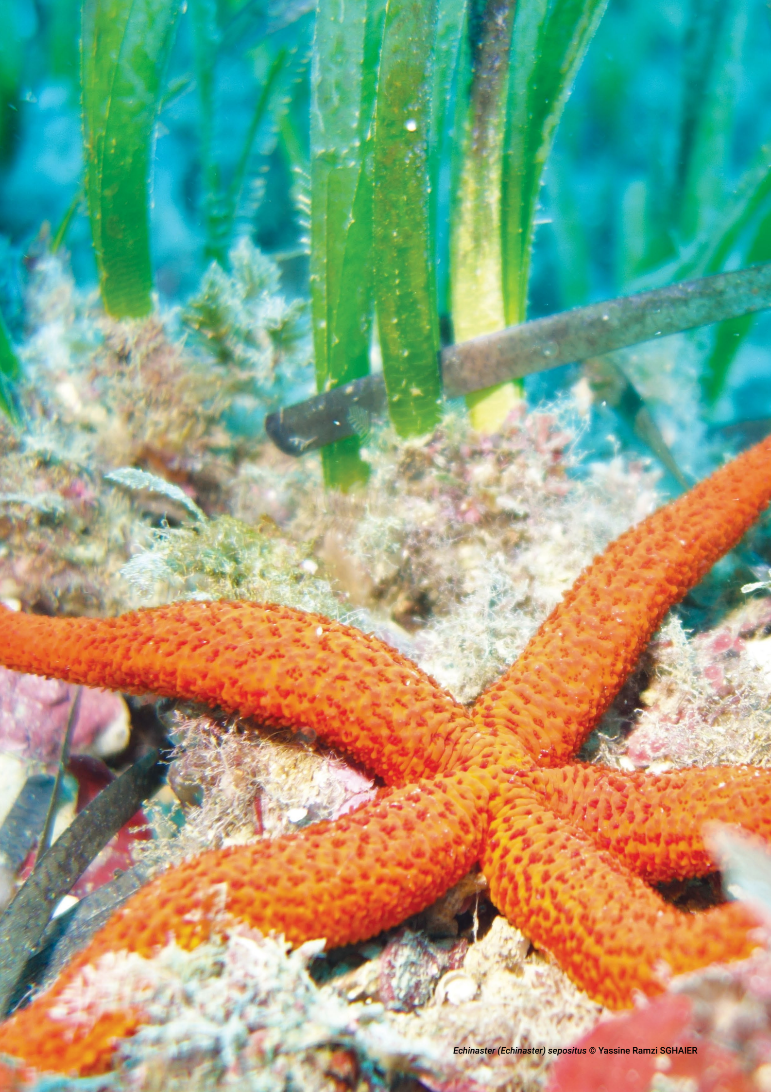
Echinaster (Echinaster) sepositus © Yassine Ramzi SGHAIER