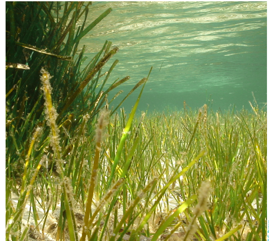
Posidonia and Cymodocea beds : Foraging areas for the Green turtles

Such protection of foraging areas for the green turtles may be a little easier to pass into law, in the European Union countries at least, as such protection goes hand in hand with the protection of the Posidonia beds, which are a priority habitat in Annex I of the Habitats Directive. The same is applicable, to a degree, to the protection of the Sand Banks which are also a habitat in Annex I, which requires protection under the Habitats Directive. Cymodocea nodosa is often related to Sand Bank habitats. This species is the main seagrass species on which juvenile and sub-adult green turtles and to a degree, adult green turtles feed on in the Mediterranean. Again, in this case, and where quantitative data on habitat coverage are available, it is possible to apply the arbitrary sufficiency levels 20-60% for non-priority habitats and >60% for priority habitats (e.g., Posidonia beds) as suggested in the Criteria for assessing national lists of pSCIs at the biogeographical level (Hab. 97/2 rev. 4 18/11/97). In this case also the "Additional guidelines for assessing sufficiency of Natura 2000 proposals (SCIs) for marine habitats and species" which are now being elaborated are relevant. Again here it needs to be mentioned that both the Bern and Barcelona Conventions have provisions to protect turtles and their habitats, without perhaps the mandatory nature of an EU Directive.