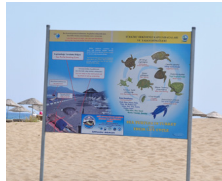
Des mesures de gestion de plage doivent être appliquées au moins durant la période de nidification, d'incubation et d'éclosion