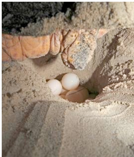
Une femelle adulte peut pondre pendant de nombreuses années produisant plusieurs centaines d'oeufs.

Les tortues femelles adultes ne peuvent pas se reproduire sans plages de nidification - fait évident. Ce qui l'est moins mais bien connue maintenant, c'est que ces femelles et peut-être plus encore les femelles de tortues vertes, ne nidifient pas sur n'importe quelle plage - elles ne le font que sur leurs plages natales, c'est-à-dire sur les plages où elles ont été pondues et sur lesquelles elles ont incubé et éclos. Par conséquent, l'existence de plages « adéquates » et l'existence de tortues femelles adultes en Méditerranée n'impliquent pas que la nidification se fera. Les femelles adultes doivent pouvoir revenir vers les plages spécifiques dont elles sont originaires pour pouvoir pondre leurs oeufs. Ceci implique aussi que le stock méditerranéen de tortues n'est pas un stock unique mais que chaque colonie a son propre stock de tortues, autrement dit, que chaque colonie est démographiquement distincte et indépendante. Par conséquent, conserver les tortues dans une colonie ne préservera pas les tortues d'une autre colonie. Pour qu'une colonie survive, il faut donc qu'elle bénéficie d'une protection individuelle et distincte. (Bowen, 1992 ; Meylan 1990.)