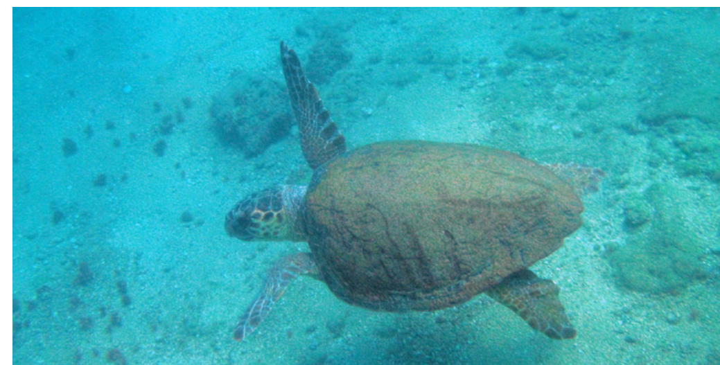
Tortue verte : Chelonia mydas

Les changements climatiques sont évidemment susceptibles d'avoir un impact, à un certain moment, et sans doute progressivement, sur la nidification des tortues et de leur distribution. Les tortues elles-mêmes vont aussi commencer plus tôt la saison de nidification compensant ainsi par elles-mêmes le ratio mâle/femelle. L'augmentation du nombre de nids est probablement due à des changements dans les courants, avec des vents qui affectent les courants de surface et amènent les eaux les plus chaudes dans les eaux peu profondes etc. Cela a déjà été observé à Chypre (Demetropoulos & Hadjichristophorou, 2008). Il est également probable que nous voyons une extension de la nidification, plus à l'ouest et une augmentation du nombre de nids dans les zones marginales de la Méditerranée centrale (Demetropoulos, 2003a). Ce qui précède devrait être gardé à l'esprit lors de la mise en place d'aires protégées en tant que frange de la zone des plages, dans le centre du bassin méditerranéen en particulier, avec peu de nidification à l'heure actuelle, pourrait devenir important dans le futur. Bien sûr, comme les tortues sont des animaux qui vivent longtemps,