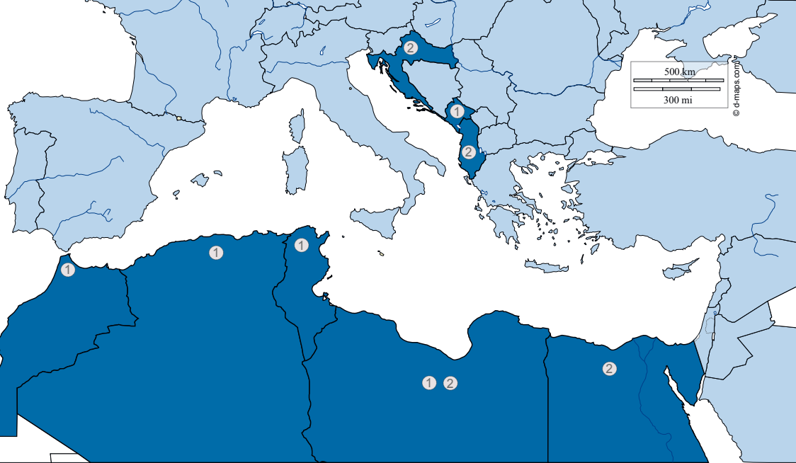
الهدف 1 الهدف 2