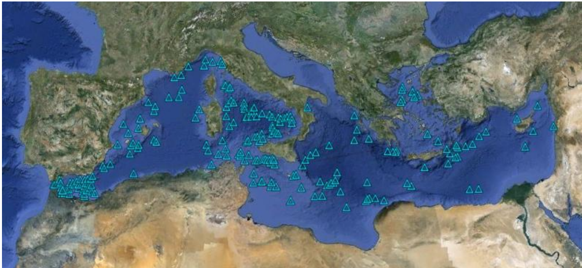
Figure 4: Distribution des principaux monts sous-marins de Méditerranée.

Ces monts sous-marins sont actuellement peu pris en compte, en terme de conservation, puisque seul celui d'Eratosthène (bassin oriental) est inscrit comme zone de pêche restreinte par la CGPM, depuis 2006 [3].