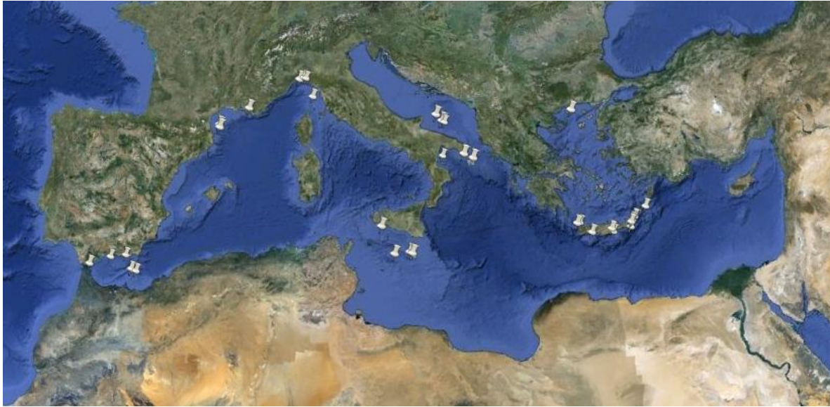
Figure 2: Localisation de quelques peuplements d'invertébrés structurants en Méditerranée. Ce sont majoritairement les « coraux d'eaux profondes » qui sont localisés (d'après auteurs du document &[8], [9], [10].

Aussi, leur présence peut être un préalable nécessaire à la mise en place de mesures de gestion spécifiques. S'ils sont actuellement encore peu pris en compte, en terme de conservation, puisque seul le « récif à Lophelia et Madrepora » de Santa Maria de Leuca est inscrit comme zone de pêche restreinte par la CGPM, depuis 2006[11], ils sont à l'origine de la création d'AMP (e.g. canyons de Cassidaigne et Lacaze-Duthiers - France). De même, deux sites ont été désignés, à ce titre, par l'Italie (Pentes continentales de l'Archipel toscan et secteur de Santa Maria de Leuca) pour la mise en œuvre du réseau Natura 2000 en mer et plusieurs sont inclus dans la proposition de mise en place d'un réseau représentatif d'AMP en mer d'Alboran [6].