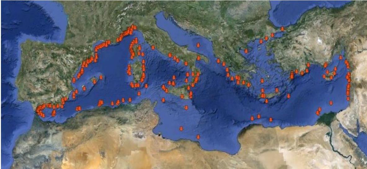
Figure 1: Distribution des principaux canyons identifiés en Méditerranée (d'après auteurs du document [3],[6]).