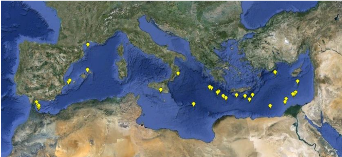
Figure 3: Localisation des peuplements chimio-synthétiques ayant fait l'objet d'étude en Méditerranée (d'après auteurs du document &[6], [12],[13], [14],[15]). Fond de carte: Google earth ©.

Les « suintements froids » semblent bien représentés le long de la ride méditerranéenne (bassin oriental; Figure 3). Les « volcans de boues » sont fréquents dans le bassin oriental en particulier au niveau de la ride méditerranéenne, et dans le sud-est du bassin, mais la découverte de « pockmarks » autour des îles Baléares laisse également envisager leur existence dans le bassin occidental (Acosta et al. , 2001, in [12]; Figure 3). Enfin six bassins anoxiques hyper-halins ont été localisés au niveau de la ride méditerranéenne [4] (Figure 3).